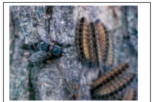
sluipvlieg Carcelia iliaca