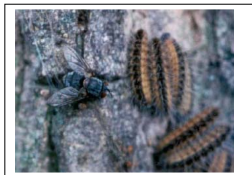
sluipvlieg Carcelia iliaca